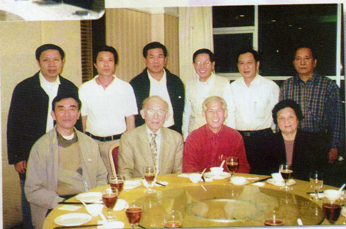
旅美伍廷典宗長（前排左二）情牽刊社，回鄉觀光後與刊社領導共叙親情。