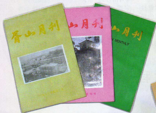
復刊初時的32開本月刊