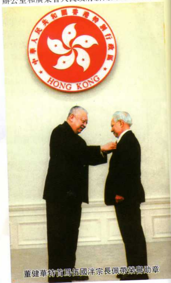
董健華特首為伍國洋宗長佩帶榮譽勳章