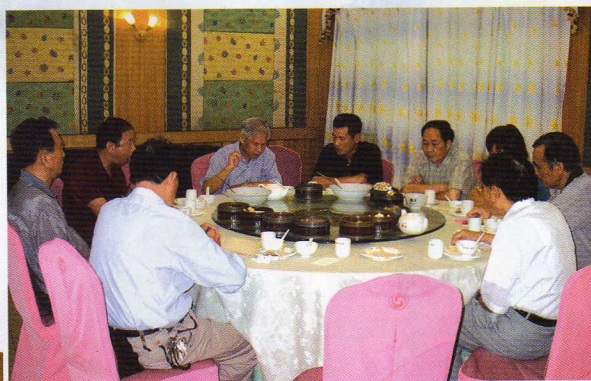
刊社常委會議研究工作