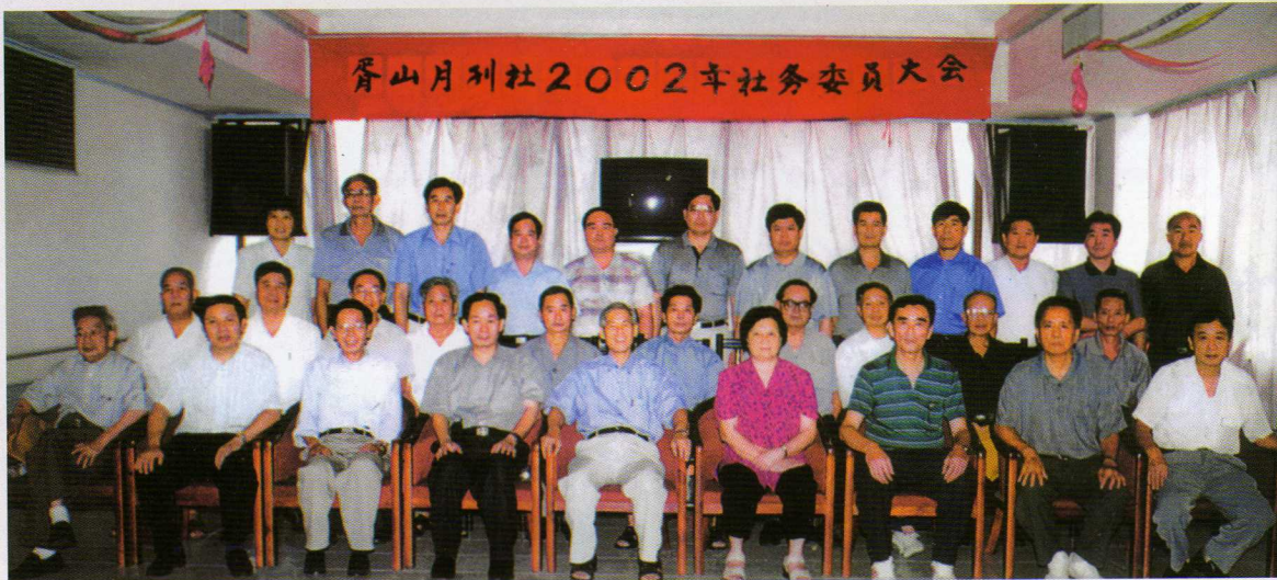
本刊社全體社務委員大會後合影