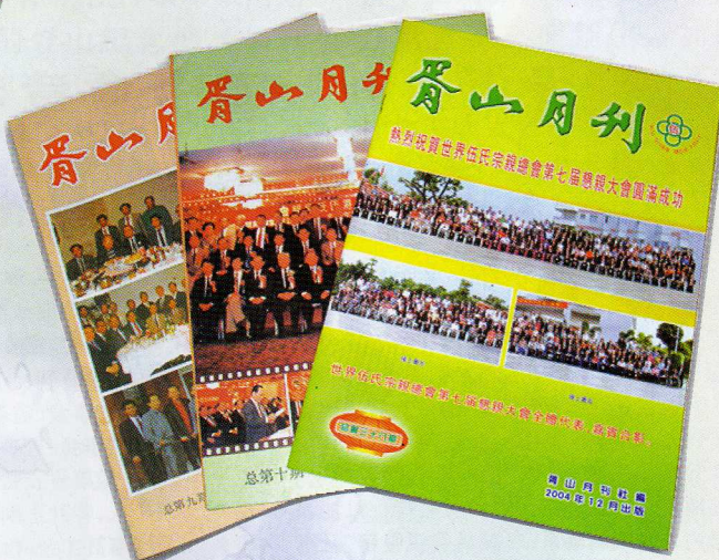
擴版後16開本的月刊