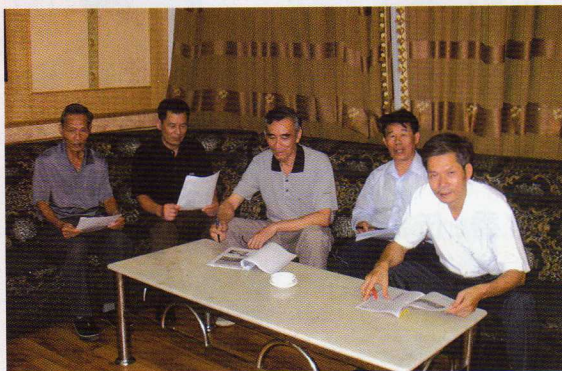
本刊編輯部人員在研究月刊的出版發行工作