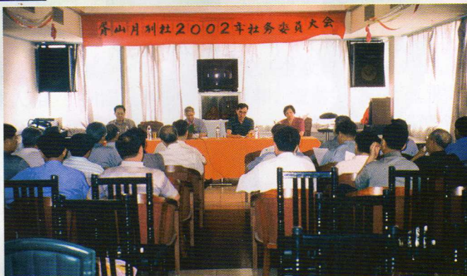
本刊全體社務委員大會場面