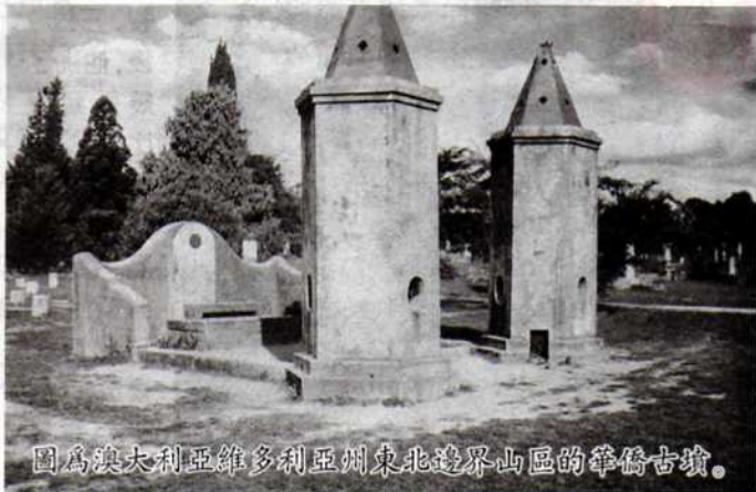
圖為澳大利亞維多利亞州東北邊界山區之華僑古墳。

這座古墓有千穴，但石碑尚存者有約五百，我伍姓有 81 個碑，在新金山之澳大利亞、維多利亞州各金礦區之先僑墳場，伍姓先僑皆集聚此埠（坑），其他各礦場很少，這可能是從前先僑之宗族觀念所形成如橫水劉姓及逕頭李姓，集中在巴拉叻（BALLARAT），塘面雷姓集中在大金山埠。