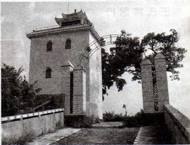
山頂上的“岡華樓”，古韻猶存。