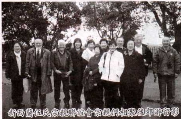
新西蘭伍氏宗親聯誼會宗親們相聚後郊游留影

是次叙會共叙天倫，聯絡宗誼，拓展族務，大家留下難忘美好回憶，話別之餘，決定下屆于2008年新年再重叙。(新西蘭 旋健)