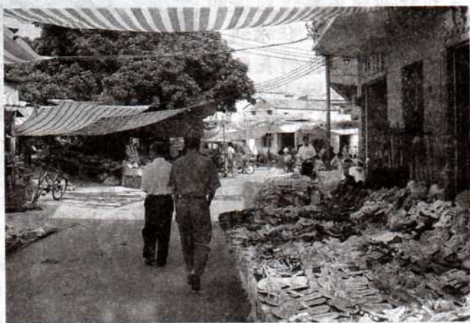
陌巷中的市場，商品琳琅滿目。