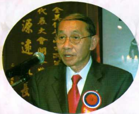
美西總顧問璇燦宗長在開幕典禮上致詞