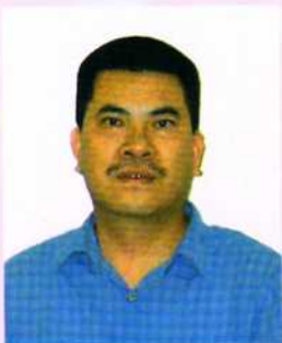
旅美伍尚齊宗長 捐美金 200 元