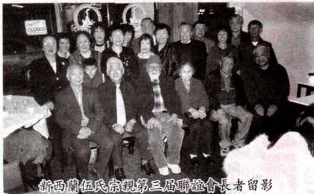
新西蘭伍氏宗親第三屆聯誼會長者留影

初晚叙餐于埠中時富酒家，次日上午暢游當地名勝古迹及參觀了世界上唯一可以見到的大鳥信天翁ALBATROSS等鳥巢之半島懸崖，巨鳥雙翼振開達十尺，飛行時速一百公里，可以在海洋繼續飛行生活多年，四年才回巢繁殖下一代，因季節問題，無緣見真鳥，祇看到了標本及上了有關奇鳥一切寶貴的一課。下午坐上了泰瑞峽谷觀光火車，這條全長二百多公里，建造于1870年代為開發中部金礦，在海拔200多米的高原峭壁、驚險懸崖中築成。現在淘金熱