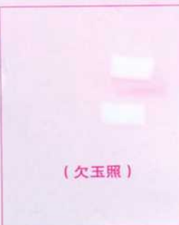
旅美伍鐵琛宗長 捐美金 100 元