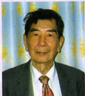
旅港伍普林宗長 捐港幣 1000 元