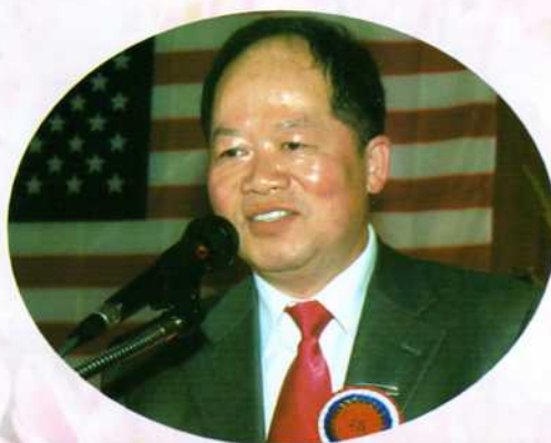
新任美西副總長柱均宗長致就職詞