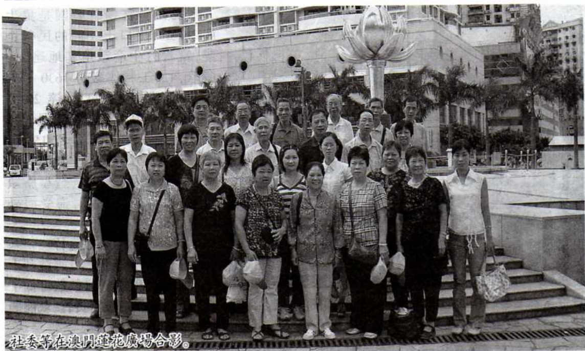
社委等在澳門蓮花廣場合影。