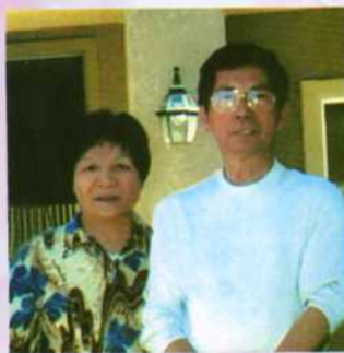
旅美伍偉圻宗長伉儷 捐美金 100 元