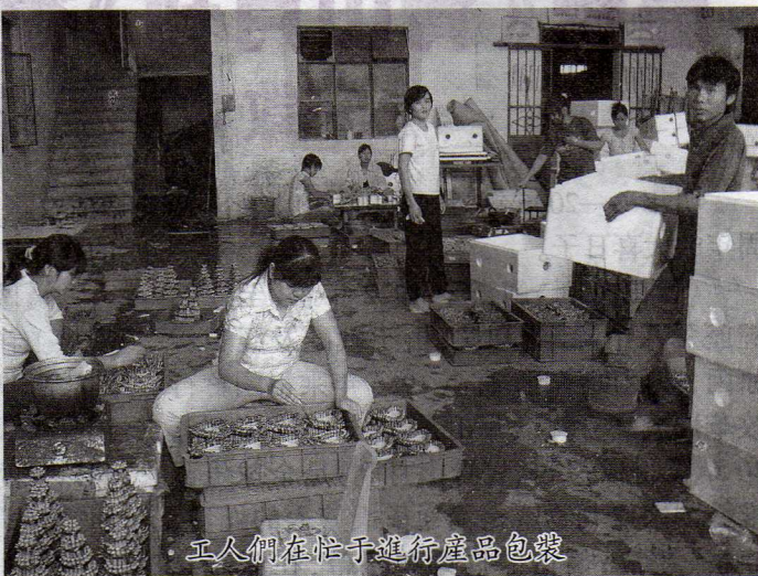
工人們在忙于進行產品包裝

從談起呢？幾個不眠之夜輾轉反側，總是冥思苦想。為了打開局面，他先到一些場區取經，學習和掌握這些花卉的種植知識，想辦法弄到一些開業的資金。於是，從1998年起，在村中租地8畝地種植富貴竹。由于他勤勞能幹，科學種植，幾年後便從富貴竹種植中嘗到了甜頭。當時，還祇是單純的富貴竹種植，加工、包裝、銷售都是由收購商負責。頗具商業頭腦的他在幾年的生產過程中逐步認識到，假如自己有實力收購、加工、包裝、出口富貴竹，經濟效益將更為可觀。2002年，他在側邊的佑村租了田地和場所，拓展了富貴竹的種植項目來了。為了使花卉的種植和藝術造形一條龍生產，他刻苦學習，掌握了生長過程的造形技巧和產品工藝裝飾等方面的知識，成為富