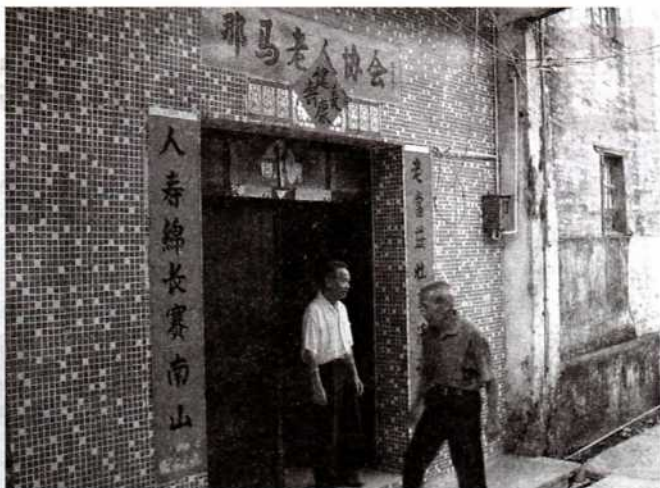
老人協會成了長者聚居之所。