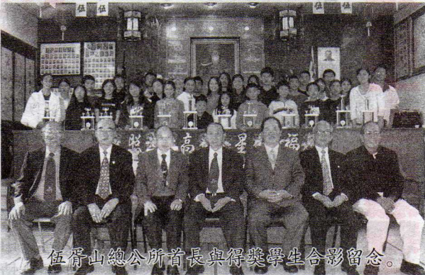
伍胥山總公所首長與得獎學生合影留念。 顧問啓照、獎學金委員會書記璇振與得獎學生合影留念。(旅美 伍郁仕)