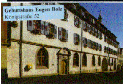
Geburtshaus Eugen Bolz Königstraße 52