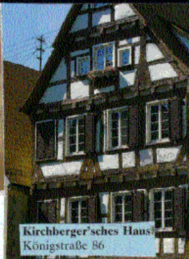
Kirchberger'sches Haus Königstraße 86